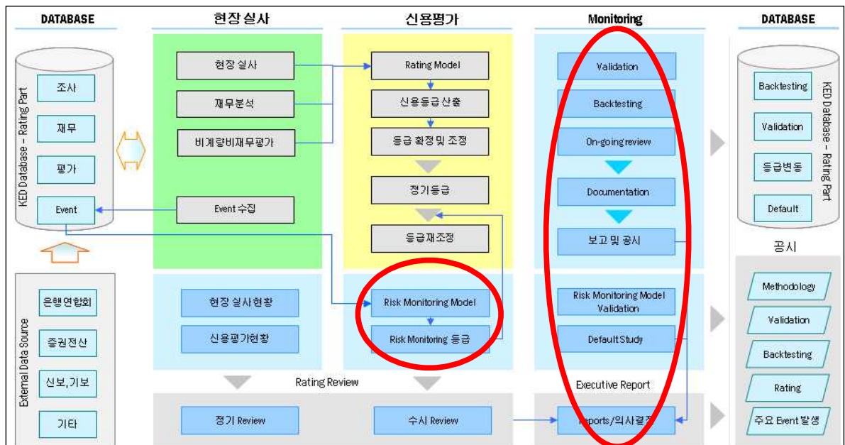
[KED의 Monitoring 기능과 적합성검증위원회 업무흐름도]